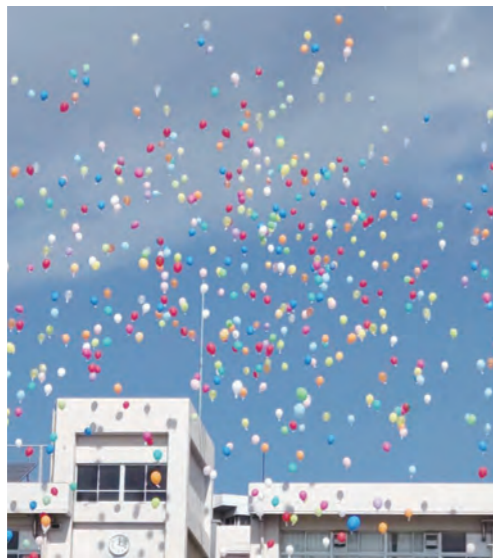
バルーンリリース

【児童代表による誓いの言葉】 今の谷津南小学校があるのは、これまでこの学校を支えてくださった地域の方々や卒業生のみなさんの、学校への気持ちのおかげです。その気持ちが、時を