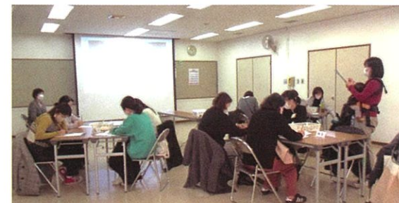
幼児家庭教育学級