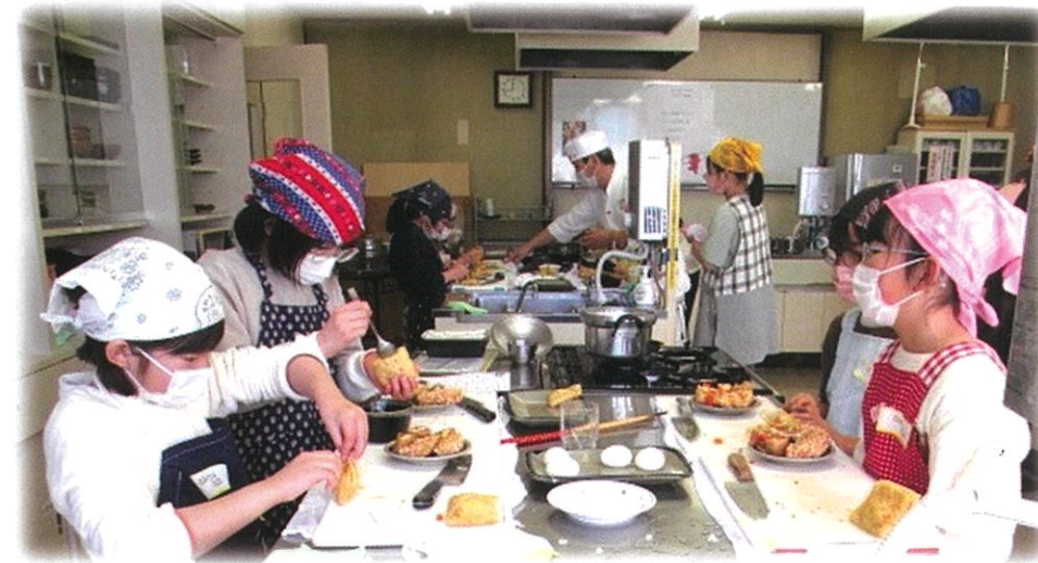
～みんな真剣なまなざしで..集中です～