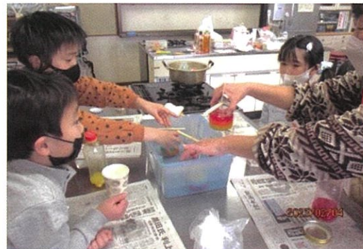
エコキャンドル作り