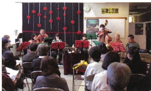
ロビーコンサート