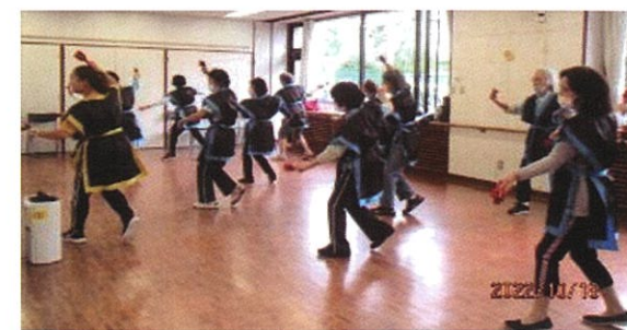
健康いいこと講座「エイサー踊り」