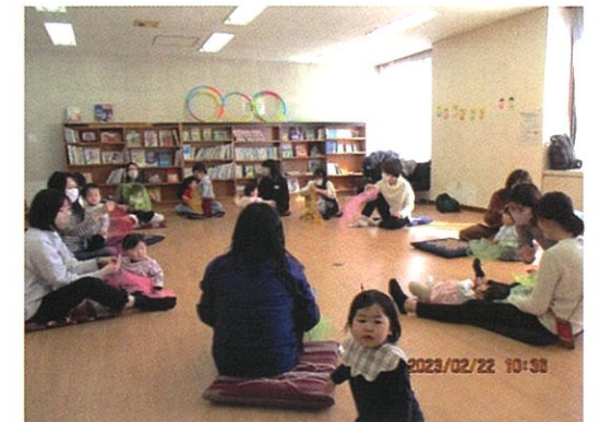
よちよち親子ルーム