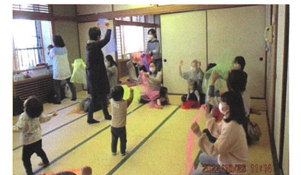
親と子のふれあい講座