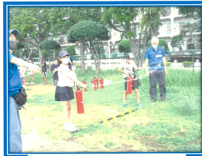
「火事だ」と大きな声を出して放水...

東日本大震災再現プログラム搭載の地震体験車では、震度7の揺れを体験しました。座って体験しましたが、モニター画面に映る家具の転倒や大きな音に、地震の怖さを身体で感じました。子どもたちの感想は「揺れが収まるまで、ダンゴムシのポーズで頭を守ることを知りました。」「消火器で火元に水を当てるのが難しかったです。」とありました。