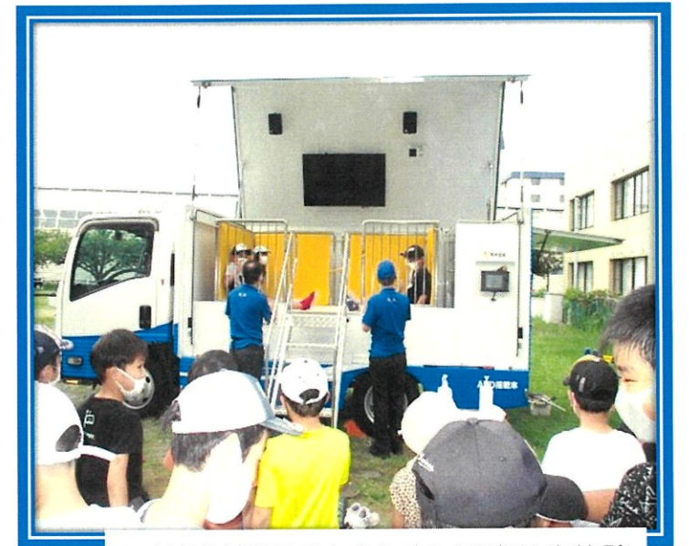
~地震体験車で大きな音と震度7を体験

初めに新聞紙がスリッパに、レジ袋が応急手当やおむつ代わりになることを学びました。液状化実験や長周期地震動による建物の揺れ方の実験を体験しました。液状化実験では、地震発生と同時に地面から水が湧き出し、家や電柱の模型が倒れていくのを見て、驚いた様子でした。