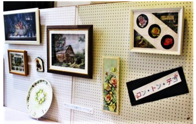
サークル コントン・デコの作品

11月上旬から公民館ロビーで開催しました「ギャラリーYatsu」も、サークル「コントン・デコ」の皆さんの展示を最後に無事終了いたしました。