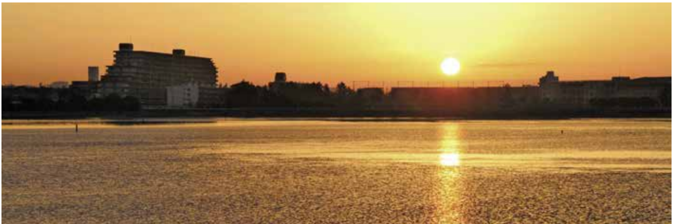
谷津干潟からのぞむ朝日