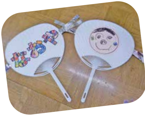
運動会の応援用に作ったうちわ