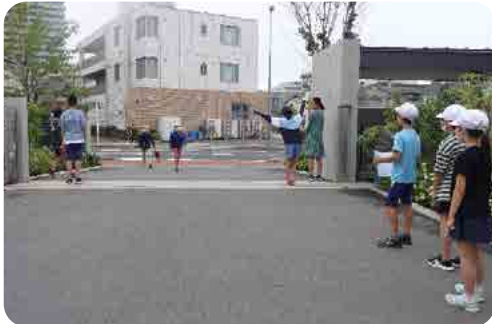
気持ちのいい挨拶で迎える子どもたち

『潮なりのひびく丘輝けり空も海も』：谷津小学校の校歌にある空と海のように、「すべての谷津つ子を輝かせたい」という思いを胸に今年度をスタートいたしました。今年度207名の一年生を迎え、児童数1,327名でスタートいたしました。本校では「感動する「あー」、気持ちのいい「あいさつ」、そして「ありがとう」の『3つのあ』を大切にしています。特に、昨年度から力を入れているのが「あいさつ」です。あかるくいつもしきりにつづけて挨拶できるようになってきた谷津つ子です。学校にも街にも気持ちのいい挨拶が広がることを心より願っております。