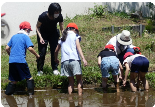
泥まみれで田植え 5年生

本校は、谷津パークタウンをはじめとした谷津3丁目と、バスで通学している奏の杜の一部を学区としております。本年度は857名(令和5年6月1日現在)の児童と54名の教職員で日々教育活動を行っております。また、谷津干潟に隣接し緑豊かな素晴らしい環境の中で、本校の子供たちは充実した学習を行っております。さらに、地域の方々の学校を支援する活動が活発で、学校敷地内の環境整備等に多大な御支援をいただいております。 本年度も職員一丸となり「チームみなみ」で教育活動に取り組みでまいります。今後とも御支援よろしくお願いいたします。