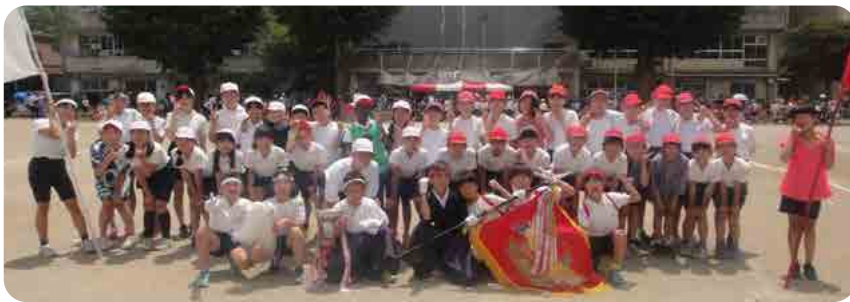
元気いっぱい！頑張った運動会

令和5年度の向山小学校は、児童数312名、職員数28名でスタートいたしました。5月27日(土)には、運動会を行いました。コロナ禍ではできなかった大声を出しての応援ができ、とびつきりの笑顔と応援の声で、大変盛り上がった運動会になりました。地域の方々にも多数ご来場いただき、子供達の元気いっぱい姿を見ていただくことができました。ありがとうございました。これからも、子供達の見守りと向山小学校へのご理解・ご協力を賜りますよう、よろしくお願いいたします。