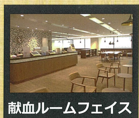
献血ルームフェイス