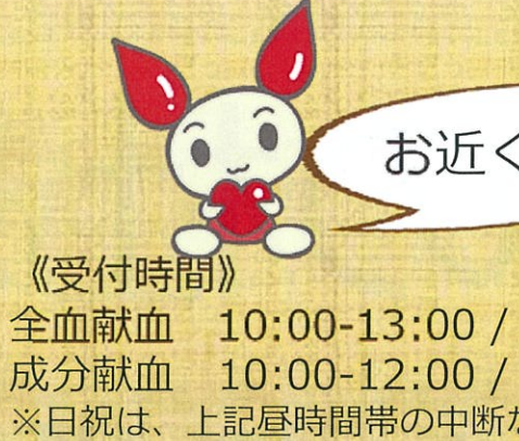
津田沼献血ルーム